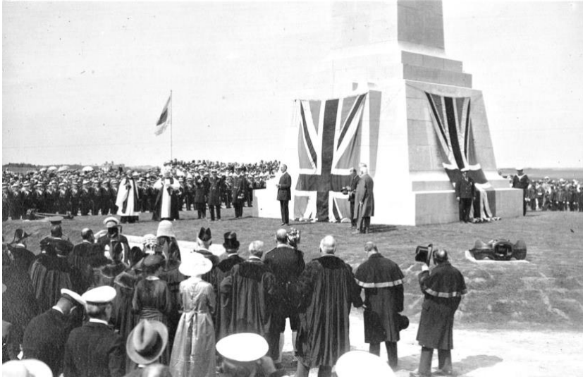
Doc 1 : Le dévoilement de l'obélisque commémorant les exploits de la Dover Patrol sur le territoire de St Margaret-at-Cliffe, le 27 juillet 1921.