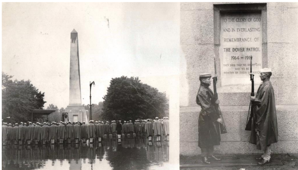
Doc 3 : Le 10 juin 1931, un troisième obélisque en hommage aux hommes de la Dover Patrol est inauguré à New York.