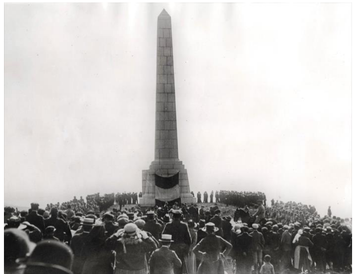
Doc 2 : L'inauguration du mémorial de la Dover Patrol à Sangatte le 20 juillet 1922

Réplique parfaite du mémorial anglais, l'obélisque français est édifié quant à lui au sommet du cap Blanc-Nez, sur un terrain concédé gratuitement aux Britanniques par la commune de Sangatte. La pose de la première pierre est solennellement effectuée par le maréchal Foch le 26 janvier 1920. L'inauguration du mémorial achevé, le 20 juillet 1922, se déroule en présence du ministre de la Marine Flaminus Raiberti et du commandant Ramsay, attaché naval anglais. Au début de la Seconde Guerre mondiale, les Allemands dynamitèrent le monument, qui fut reconstitué à l'identique et inauguré à nouveau en juillet 1962 en présence des ministres de la Défense britannique (Harold Watkinson) et français (Pierre Messmer).